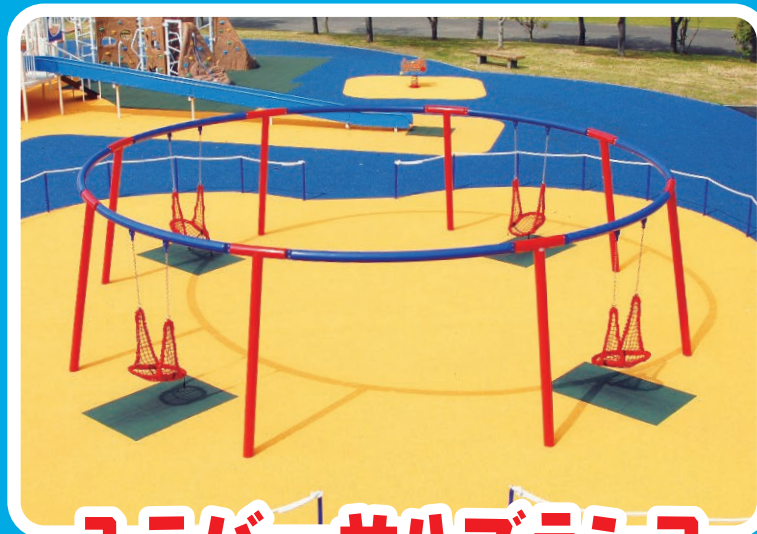
ユニバーサルブランコ