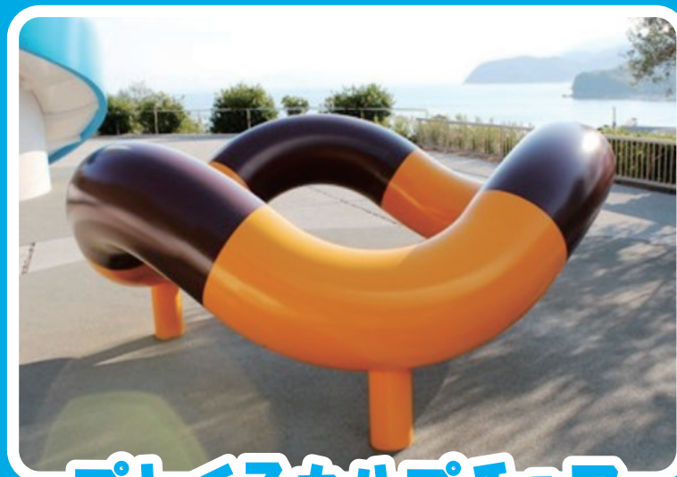
プレイスカルパチョア