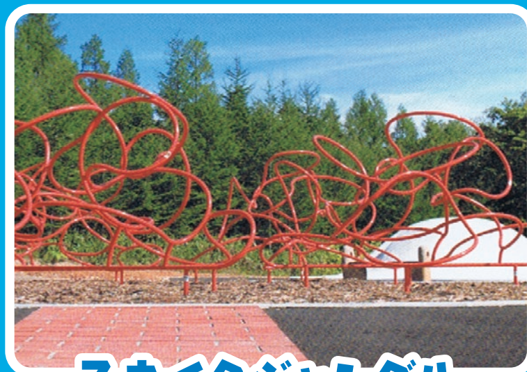
スネイクジャングル